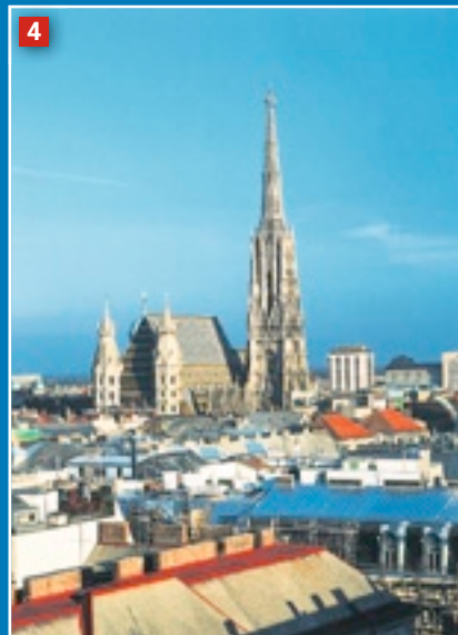
1 Le Naschmarkt, c'est près de 200 stands et cafés. 2 La place centrale du Museums-Quartier, idéal pour lire, papoter ou boire des verres en toute décontraction. 3 Sur les quais du canal, ça sent les vacances. 4 Le Stephansdom, emblème de la ville.

semblent à volonté, attirent la jeunesse.